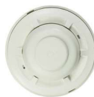
Detector de fuego