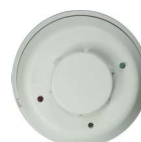
Detector de humo