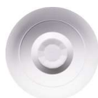
Detector de presencia